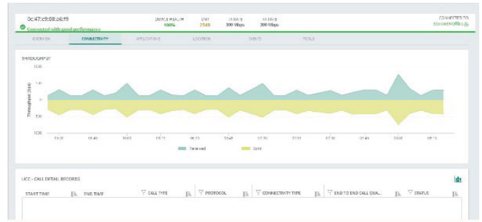
Стан клієнту та статус підключення